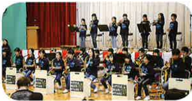
石神小ブルースターズ