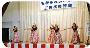
フラダンスさくら会