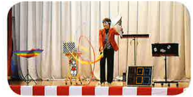
東海マジシャンズクラブ