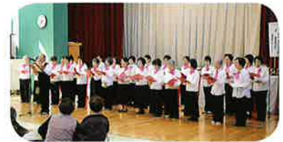
童謡抒情歌を楽しむ会