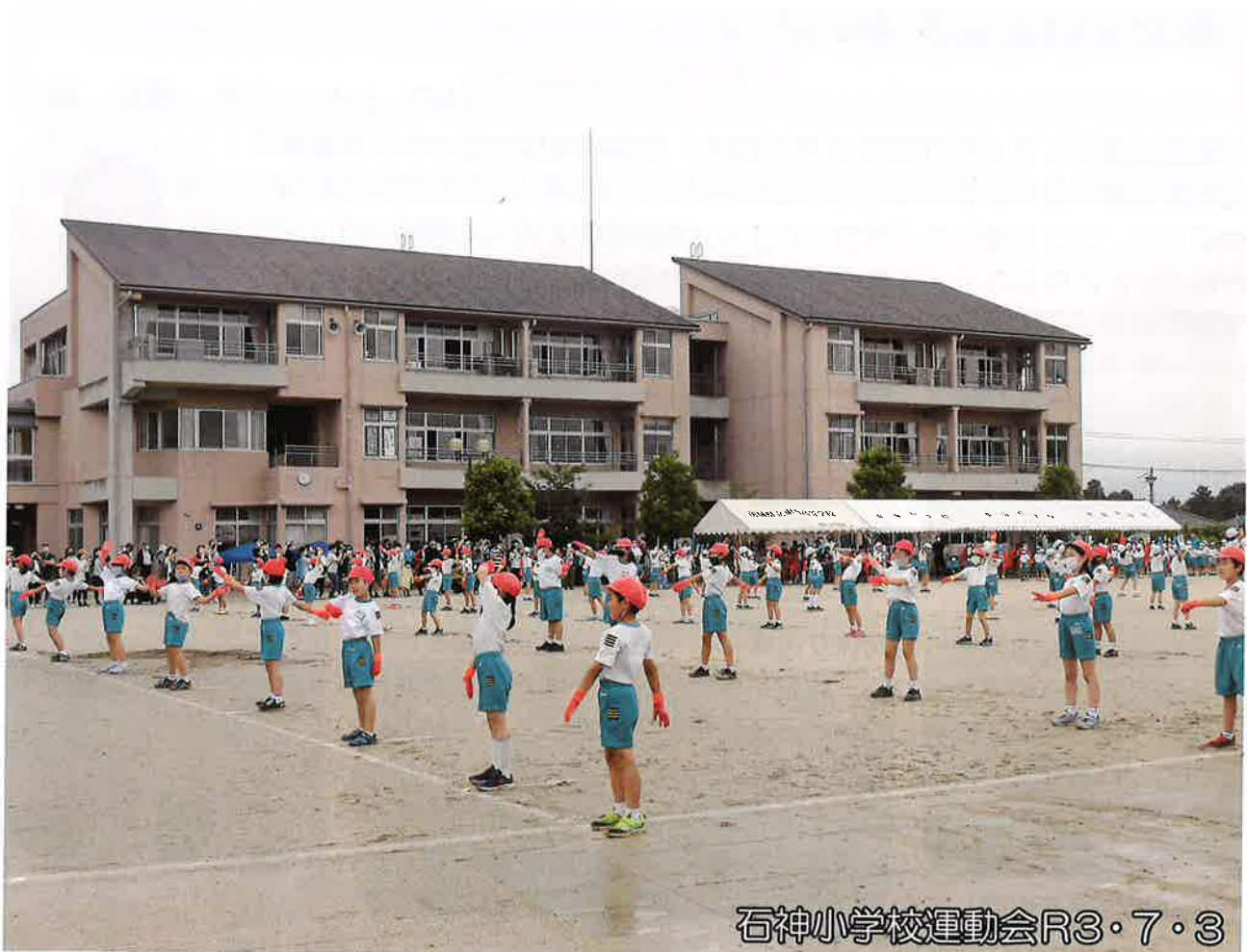
石神小学校運動会R3・7・3