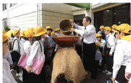
唐箕の実演に興味津々

昼食の準備は子供たちも配膳を手伝い、食事後はクイズやジャンケン大会をとおして会話が弾み、交流を深めることができました。