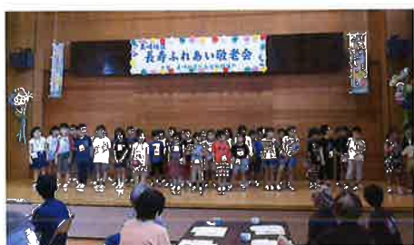
村松小2年生の発表

真崎コミセンでは、「一緒に踊ろう～エンカサイズ～」で体を動かし、村松小学校2年生の児童の皆さんのかわいい歌声や、心のこもった手紙のプレゼントで楽しい一時を過ごしました。舟石川三区集会所では、区内の皆さんによるやコーラス、二人羽織、演芸「麦畑」などの演目に大いに盛り上がりました。いつまでも元気で健やかに過ごしていただくことを願っています。