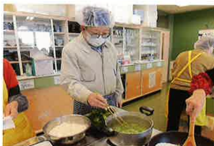
男性陣も頑張ってます