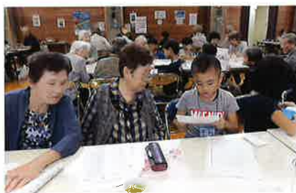
お手紙のプレゼント