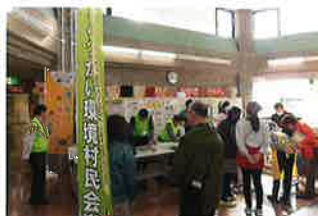
環境についてのパネル展示