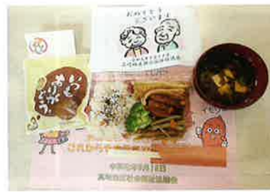
手作りのお赤飯でお祝い