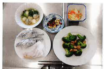
今回のメニューです

「チャレンジ99クラブ」に入りませんか？ みんなで認知症を勉強し、健康寿命を延ばす会です！