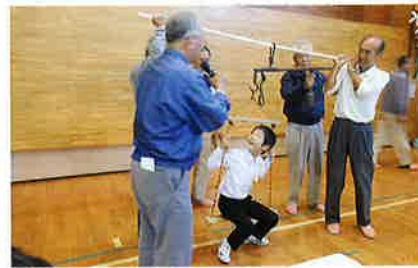
昔の道具で体重測定