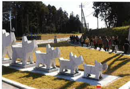
ギャラリーロード