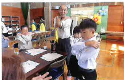
一緒にシルバーリハビリ体操