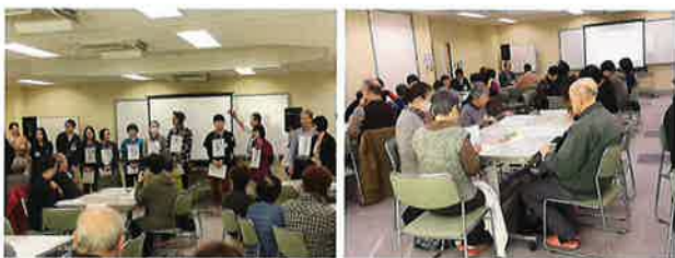
真剣に認知症予防講座を受講

総会で承認された事業計画に従い、月例役員会で、地区自治会の行事の計画立案や地域の課題について話し合っています。11月には単位自治会と共催で「認知症予防講座」を開催するなど、地域と密着した行事も企画しました。これからも、地域活動の活性化を目指し取組んでまいります。