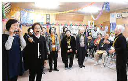
ひまわりサロンのみなさん