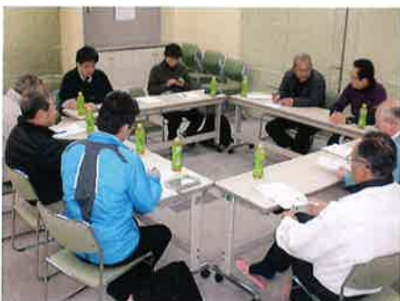
企画・総務部会の様子

企画・総務部会では「地区自治会だより」の企画、編集を行い年3回発行しています。地区内の行事の案内や地区自治会の専門部会、各団体の活動や紹介等、身近な情報をお伝えしています。地域の話題をたくさん掲載しますので、皆さんからの情報やお便りもお待ちしています。