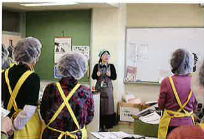
講師の先生の講話

今回の調理実習は、中華風ちまき、ブロッコリーと海老の炒め物、白菜の甘酢あえ、白玉と肉団子と菜花のスープ、カシューナッツの餡からめの5品に挑戦しました。メニューの準備と調理、工程を考えながら手際よく作業して、時間内に完成しました。作った料理はみんなでおおいしくいただきました。