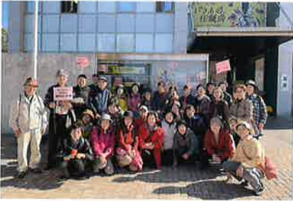
茨城県陶芸美術館

茨城県陶芸美術館を見学後、笠間芸術の森公園→ギャラリーロード→笠間稲荷神社→日動美術館駐車場までの約3.0kmを歩くコースでした。稲荷神社では菊まつりも開催中で、門前通りを自由に散策し、1日満喫してリフレッシュできました。