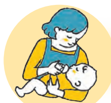
自宅や絆等での一時預かり