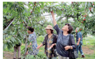
▲機能回復訓練の様子