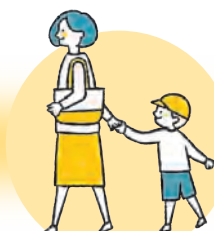
保育園や幼稚園、学童への送迎