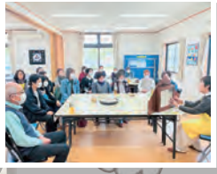
▲南台区自治集会所 (ふれあいカフェ南台)

地域の方が、コミセンや集会所など歩いて行ける場所に集い、つながり合う地域の居場所です。