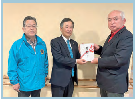
東海ライオンズクラブ様より ご寄付をいただきました