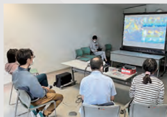
▲参加者同士が交流する機会を 設けています