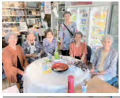
▲清水屋商店 (ともちゃんサロン)