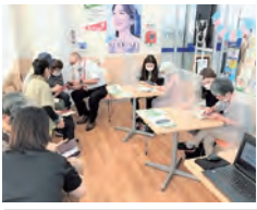
▲ウェルシア薬局東海舟石川店 (ウェルカフェ)