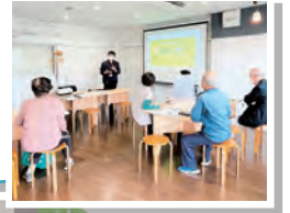
▲コミュニティスペースLien (ぶらっとスマホ広場)

貸切スペースを活用し、イベント・講座・ワークショップ等を開催する、多世代が交流する居場所です。