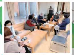
▲グループホームメジロ苑 (認知症カフェビレッジバード)

認知症の方や家族、介護や医療に関わる方、地域の方など、誰でも参加できる居場所です。