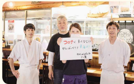
▲やんしゅうばんや八角様